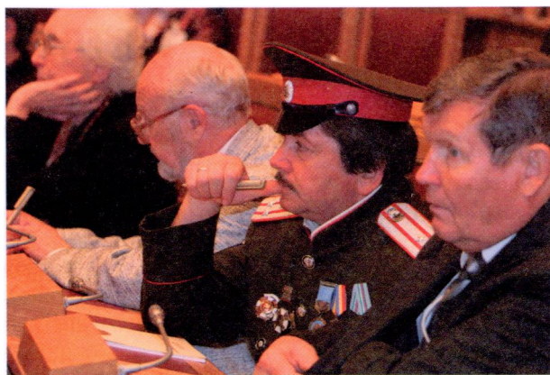
МЕСТО ПРОВЕДЕНИЯ КОНГРЕССА - САНКТ-ПЕТЕРБУРГ, ТАВРИЧЕСКИЙ ДВОРЕЦ